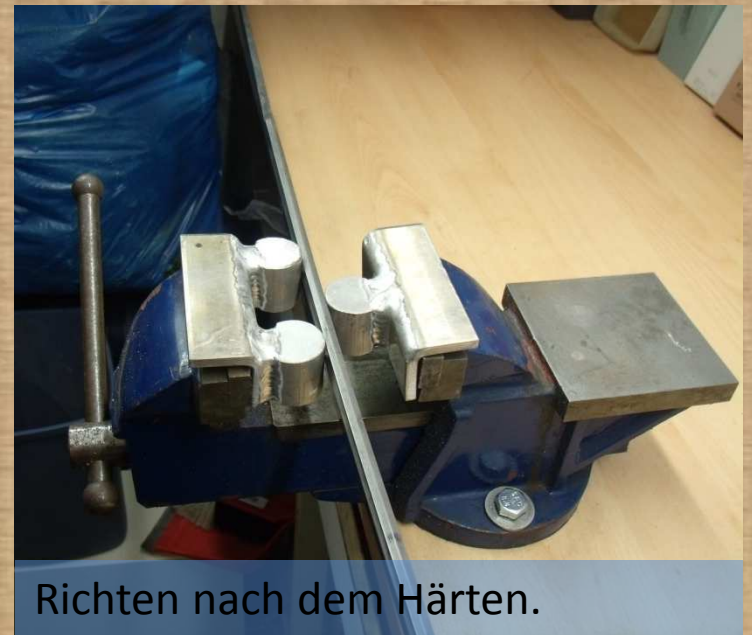
Richten nach dem Härten.