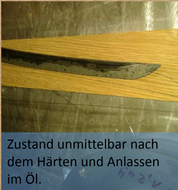
Zustand unmittelbar nach dem Härten und Anlassen im Öl.