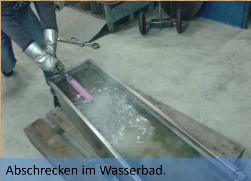
Abschrecken im Wasserbad.