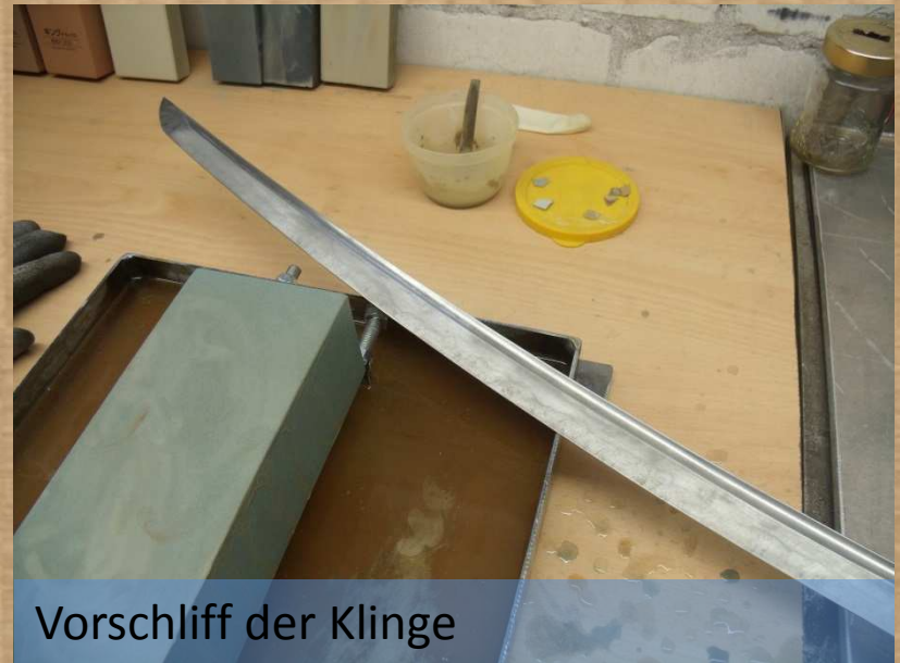
Vorschleiff der Klinge