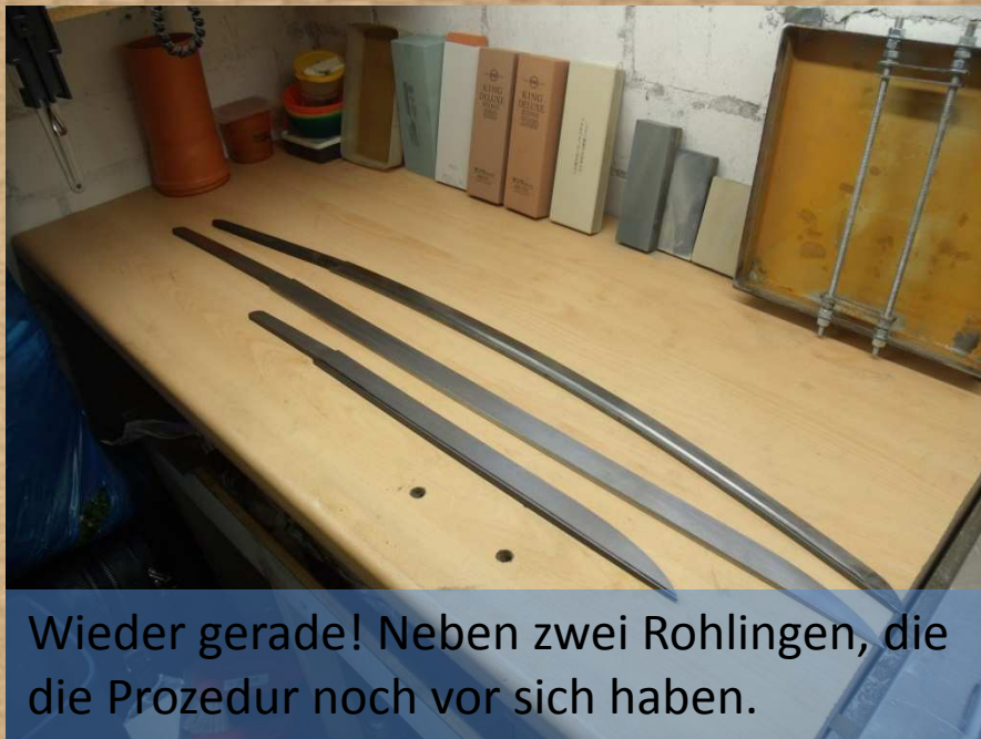
Wieder gerade! Neben zwei Rohlingen, die die Prozedur noch vor sich haben.