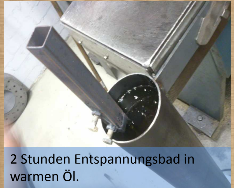
2 Stunden Entspannungsbad in warmen Öl.